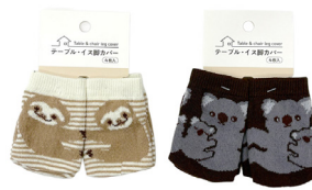
Table & chair leg cover

インナー入数 12 カートン入数 240 Inner pcs Carton pcs