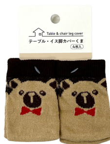
Table & chair leg cover