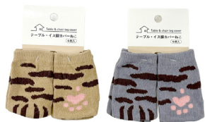
Table & chair leg cover

インナー入数 12 カートン入数 240 Inner pcs Carton pcs