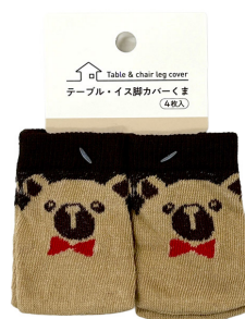
Table & chair leg cover

インナー入数 12 Inner pcs カートン入数 240 Carton pcs