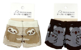
Table & chair leg cover

インナー入数 12 Inner pcs カートン入数 240 Carton pcs